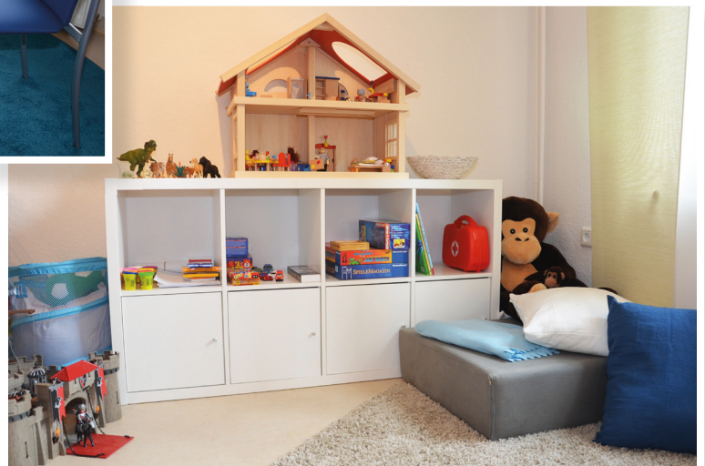
Beratungsräume in der Zweigstelle der Lebensberatungsstelle in Wiesenau.